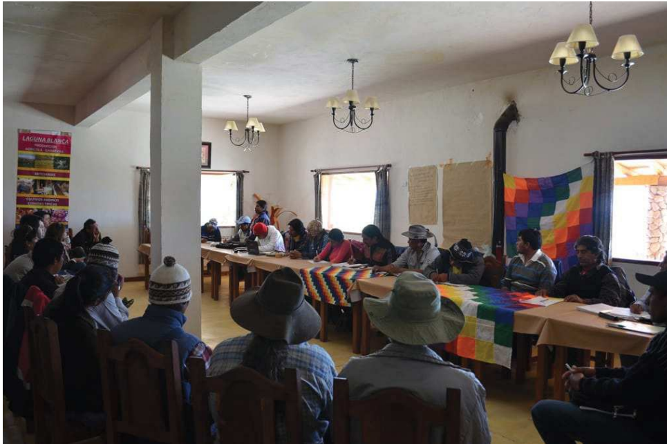
Asamblea de comunidades de la Nación Diaguita de Catamarca. Laguna Blanca, 1/4/2016

Por dar un ejemplo, el caso de la orden de desalojo firmada por el juez en favor de la familia terrateniente contra un comunero de la Comunidad Aborigen de Corral Blanco y su familia: en calidad de ciudadano común, es decir, como individuo serial de la sociedad civil, el comunero no tenía instrumento legal alguno con el que defender sus derechos sobre la tierra, pero en tanto miembro de una comunidad aborigen , le ha sido posible dar con un amparo contra la orden judicial. Luego, la continuidad de las prácticas campesinas en el uso del territorio nos posibilita hablar de derechos históricos de larga duración que podrían en la actualidad ser reconocidos por el Estado nacional como derechos comunitarios ancestrales y en función de los cuales, se puede apelar a la preexistencia de derechos naturales u originarios de las comunidades indígenas, al amparo de lo que los caciques llaman el «derecho mayor» y por el que pueden abrirse paréntesis cobertores en el sistema jurídico regido por la propiedad privada. Lo que nos lleva a observar, pues, que las tácticas y estrategias políticas en torno al territorio de las familias campesinas puneñas, han variado su forma y naturaleza en función de las posibilidades prácticas de cada etapa histórica, y que, contra los supuestos que pudieran haberse hecho al respecto, la “pasividad” no es su naturaleza sino una estrategia política al no disponer de instrumentos para afirmar sus derechos contra los derechos de los grandes propietarios.