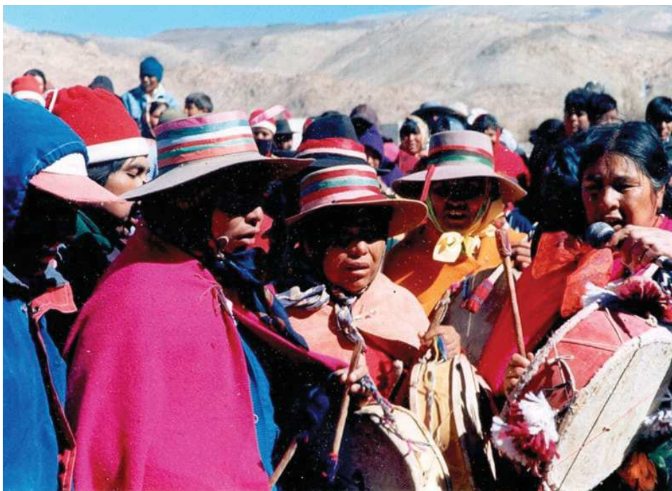
Celebración de la Fiesta de la Pachamama durante el 1º de agosto.

como también la cría de aves de corral o el cultivo en los patios de las casas. En cuanto al trabajo artesanal de la lana de oveja y de camélidos, es una ocupación generalizada que puede llegar a tener un lugar significativo en la economía doméstica, sobre todo en las familias algunos de cuyos miembros participan de la cooperativa que organiza la captura y esquila de la vicuña (Cooperativa Mesa Local de la Vicuña). En suma, lo que puede observarse en este proceso de concentración poblacional es un conjunto de tensiones entre las prácticas tradicionales campesinas y la vida más urbanizada en el pueblo, en el que si bien han tenido lugar rupturas, también tienen lugar plegamientos entre las prácticas (como la complementariedad del trabajo asalariado con el trabajo artesanal de la lana o la horticultura). En fin, este es el panorama social general en el que, en los últimos diez años, las familias campesinas de la región comenzaron a reconocerse y organizarse como comunidades indígenas.